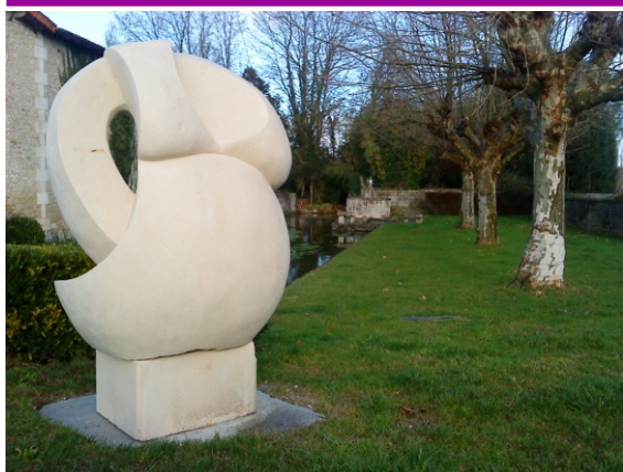
Le Cycle doux, maternité et nature ne font qu'un.

Avant les fêtes de fin d'année, une sculpture imposante a trouvé place au cœur de Triac près du lavoir au square de la Fontaine. Les formes généreuses de cette œuvre en pierre interrogent. Sa mise en place est idéale car elle offre à votre regard ses deux faces si différentes. Devant on reconnaît les formes délicates créées par la maternité, l'autre face nous transporte dans l'intimité du cocon maternel, là où l'enfant en devenir va conjuguer avec sa mère pendant